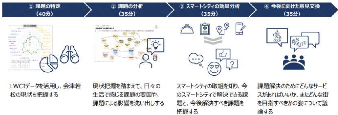
図表2 ワークショップの全体像