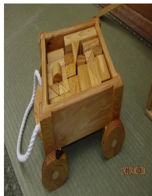
（積み木50ピースと積み木収納カート）