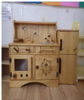
（ままごとキッチンと冷蔵庫）

・子育て支援センター：大工セット、積み木、積み木収納カート、カーハウス。（323,950円）