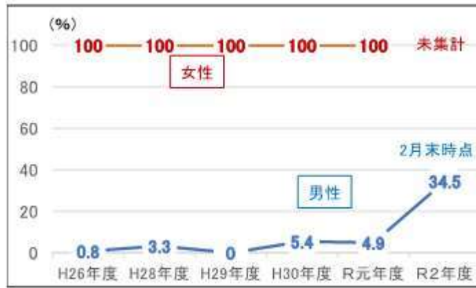
図表4 育休取得率の推移