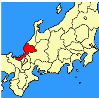
図表1 福井県の位置図