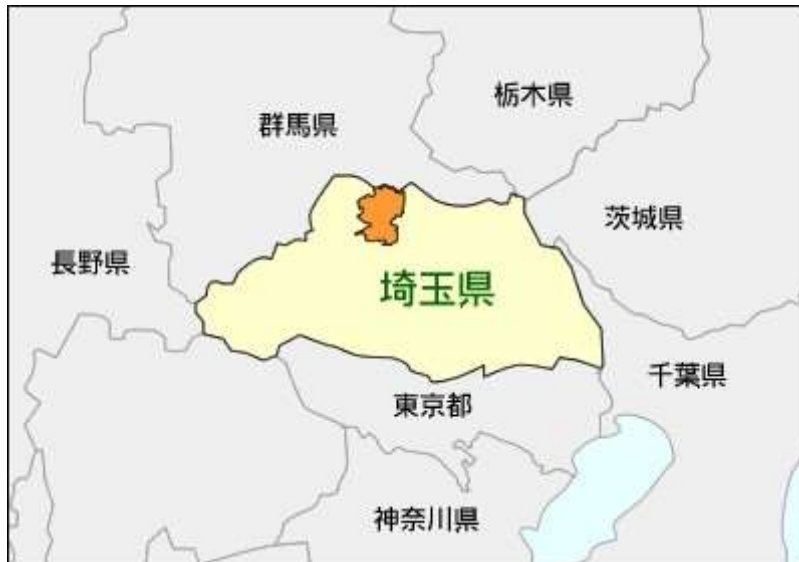
図表 1 深谷市の位置図