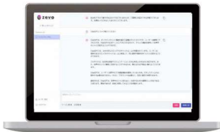
図表2 「zevo」のイメージ画面

出所：PRTIMES「都城市で ChatGPT に係る行政利用調査研究事業を開始！」