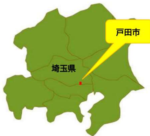
図表 1 戸田市の位置図