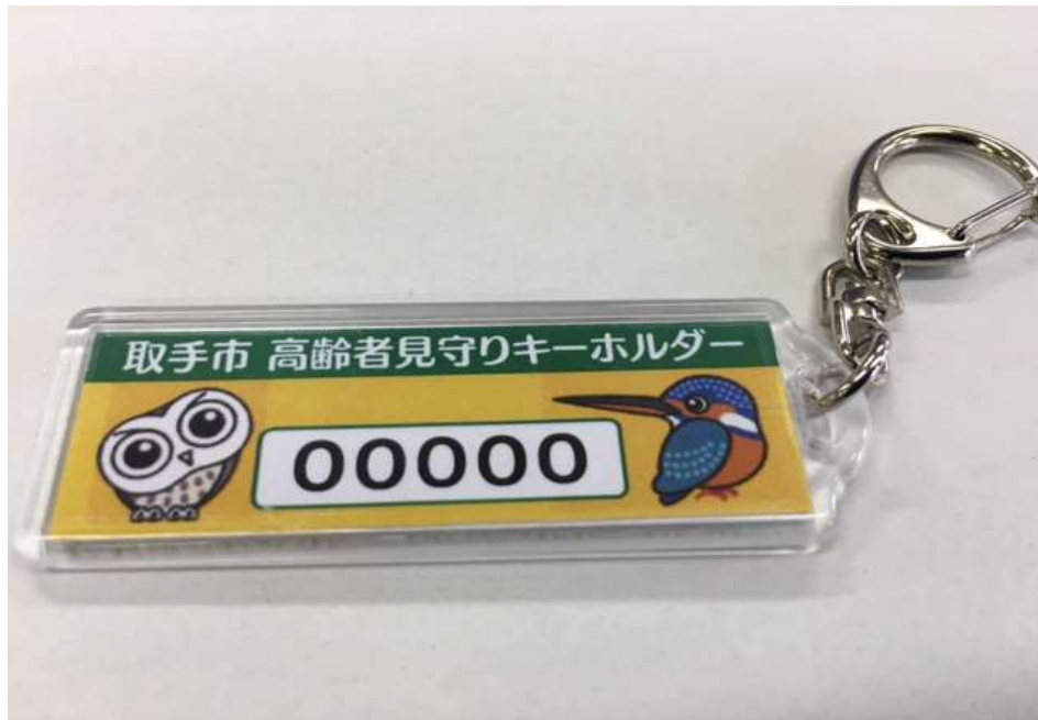
図表4 登録者に配布されるキーホルダー