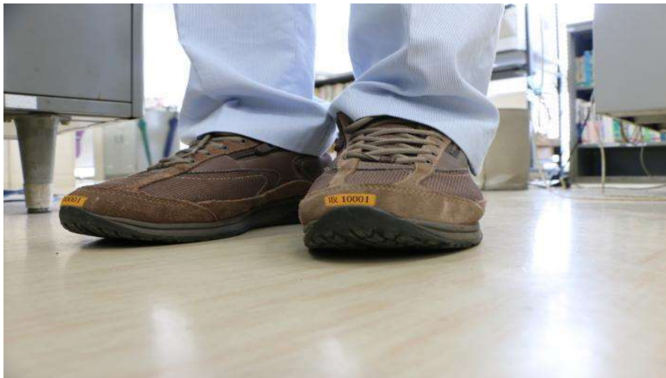
図表5 登録者に配布されるステッカー