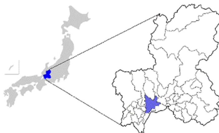
図表1 岐阜市の位置図