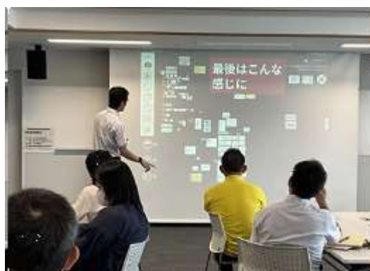
図表3 イベントの様子

市内の小中学校で「ロイロノート」が活用されるようになってから、様々な研究会、公開授業、研究発表会で、「ロイロノート」を効果的に活用した提案がされるようになった。また、岐阜市教育委員会が主催する研修に加えて、「ロイロ認定ティーチャー」を中心とする教員同士の主体的な勉強会も開催されてきた。また、岐阜県には、「LEG 岐阜」という、ロイロ社に認定された、ICT 利用を推進するために誕生した地域の教育者のグループもあり、イベントを通じて、授業デザイン等を学ぶことができる機会も存在する。これらのイベント等で、「ロイロ認定ティーチャー」や教員は、「ロイロノート」を利用した、授業改善に努めている。