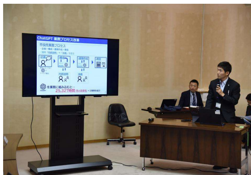
図表 3 「ChatGPT 活用コンテスト」の様子

最後に、第五として、これまでに蓄積された ChatGPT に関するノウハウを、他自治体に伝える取組が実施されている。多くの自治体からの問い合わせに対する対応や、講演会等における情報提供が行われてきたが、これらに加えて、ChatGPT 導入から活用までのノウハウをパッケージ化した、自治体用の研修「横須賀生成 AI 合宿」が、令和 6 年 1 月に実施された。さらに、市では、生成 AI の活用に積極的な複数の自治体や note 株式会社と協働して、「自治体 AI 活用マガジン」という、各自治体の生成 AI 活用に関する知見を共有するサイトを開設した(横須賀市が運営)。