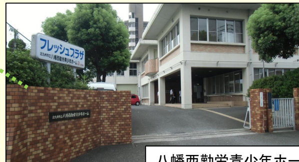
八幡西勤労青少年ホーム