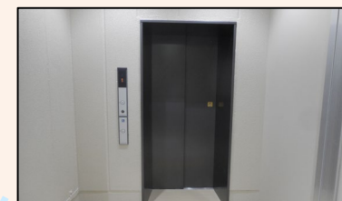
エレベーター(新設)