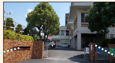
八幡西生涯学習総合センター折尾分館